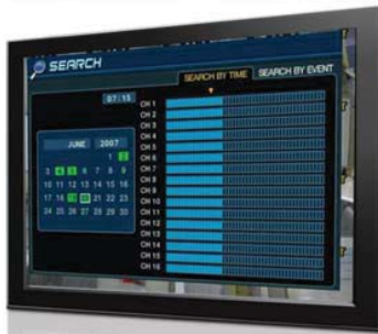
Menu de recherche